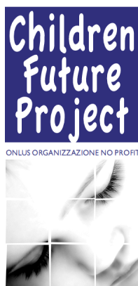
Tabella riassuntiva progetti